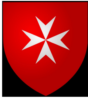
Orden Cruz de Malta